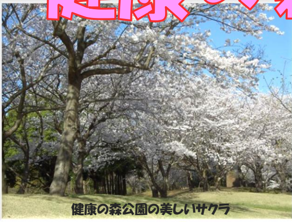
健康の森公園の美しいサクラ