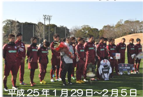
平成 25 年 1 月 29 日～2 月 5 日