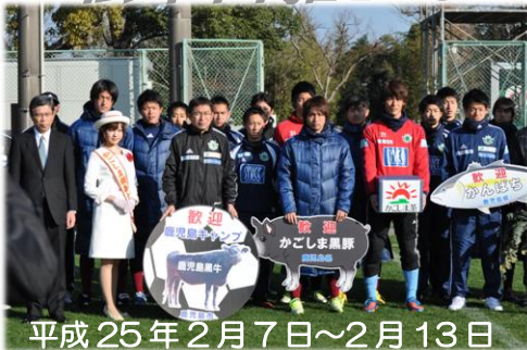
平成 25 年 2 月 7 日～2 月 13 日