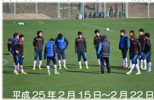
平成 25 年 2 月 15 日～2 月 22 日