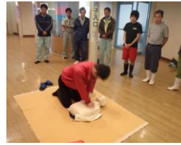
毎月の AED 講習

健康の森公園では万が一の場合に備えて、迅速かつ正確に救命救急対応ができるよう、毎月 AED 講習に取り組んでおります。