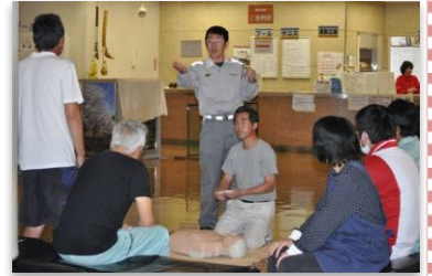
伊敷分遣隊による講習(年2回)