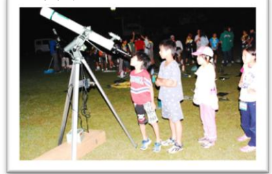
真冬の空は星がきれい☆

申込み 往復ハガキに『学習会から参加』もしくは、『星座の観賞会に参加』を記入し、住所、 氏名、年齢、電話番号を書いて1月29日(水)必着