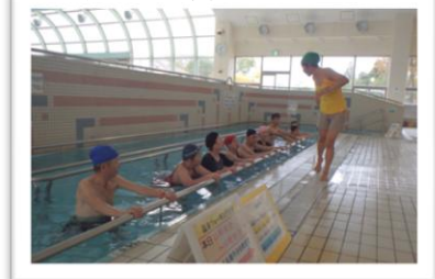
効果的な水中歩行のコツを！

申込み 往復はがき(お一人様1枚)教室名、住所、氏名、年齢、電話番号を書いて2月3日(月)必着