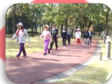
ジョギングコース(700m)