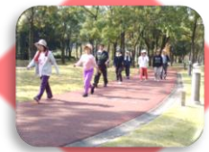
ジョギングコース(700m)