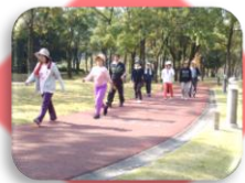
ジョギングコース(700m)