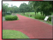
ジョギングコース(700m)