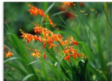
四季の山野草 ヒメヒオウギズイセン

アクアジム前、わんぱく広場周辺に ハイビスカス が咲いてます！ 色は赤、オレンジ、ピンクです。 夏の花は元気をくれます！ ぜひご覧ください。