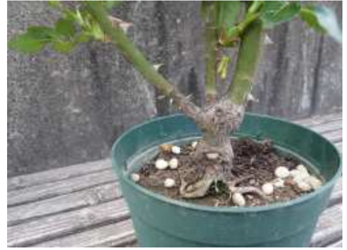
バラ苗を上から見て枝が均等に広がっている苗