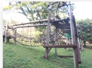
自然を生かしたアスレチック