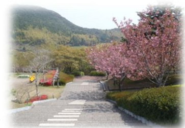
園内にはソメイヨシノなどの桜が200本。