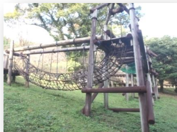
自然を生かしたアスレチック