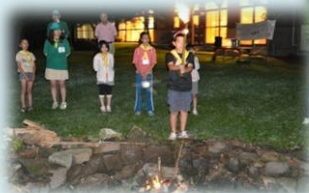
キャンプファイヤーは一生の思い出