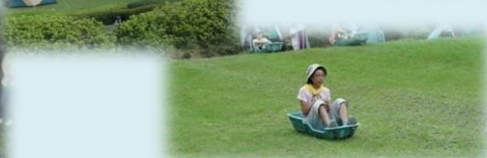
多くの皆様にお出でいただき 本当にありがとうございました