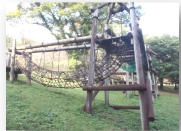
自然を生かしたアスレチック