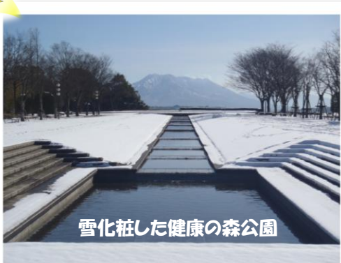
雪化粧した健康の森公園