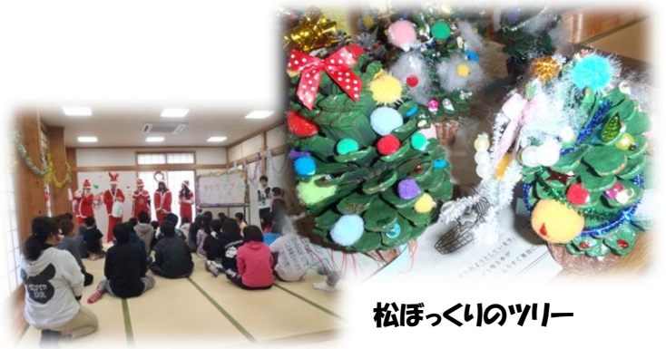
松ぼっくりのツリー

今年も多くの飾りつけと出し物で大いに盛り上がりました。また松ぼっくりを使ったクリスマスツリーをみんなで作って楽しみました。