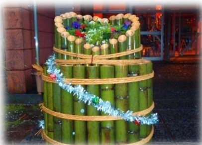
ハート型のキャンドル兼かど松