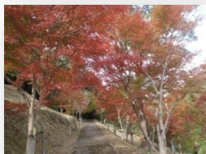
秋は紅葉が綺麗です

鹿児島市街地から桜島、錦江湾まで望む絶好のロケーション。管理棟を兼ねた交流促進センター「てんがら館」、7棟のコテージ、野外ステージ、キャンプ場、遊具など完備した公園です。