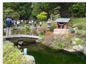
甲突川の源流「甲突池」

鹿児島市街地から桜島、錦江湾まで望む絶好のロケーション。管理棟を兼ねた交流促進センター「てんがら館」、7棟のコテージ、野外ステージ、キャンプ場、遊具など完備した公園です。