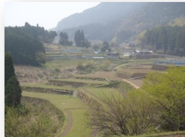
公園近くの八重の棚田