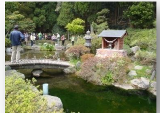
甲突川の源流「甲突池」

鹿児島市街地から桜島、錦江湾まで望む絶好のロケーション。管理棟を兼ねた交流促進センター「てんがら館」、7棟のコテージ、野外ステージ、キャンプ場、遊具など完備した公園です。