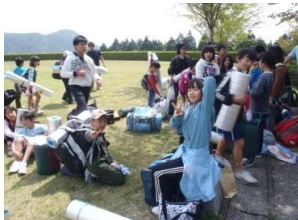
夏はやっぱりキャンプが一番

八重山公園キャンプ村のコテージ、てんがら館、テント等のご予約は利用日の半年前から賜ります。電話でのご予約は朝8時30分から。ただし、直接朝受付まで来られたお客様を優先致します。直接来られたお客様が複数の場合は抽選を行いますのでご了承ください。なお、仮予約はできません。すべて本予約となりお一人様、1回の予約につき1件とさせていただきます。