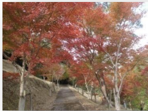
秋は紅葉が綺麗です

鹿児島市街地から桜島、錦江湾まで望む絶好のロケーション。管理棟を兼ねた交流促進センター「てんがら館」、7棟のコテージ、野外ステージ、キャンプ場、遊具など完備した公園です。