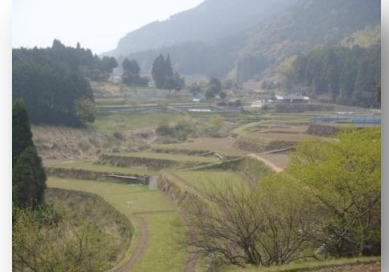
公園近くの八重の棚田