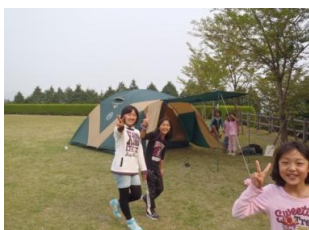
キャンプの思い出は一生の思い出