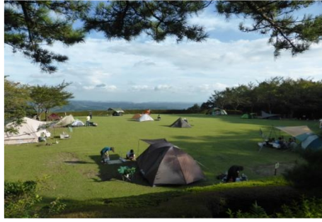
景色が好評な多目的広場

9月も、多目的広場は多くのテント泊利用者が訪れました！。まだテント泊をされたことのない方は、ぜひ八重山公園でキャンプにチャレンジしてみませんか！？