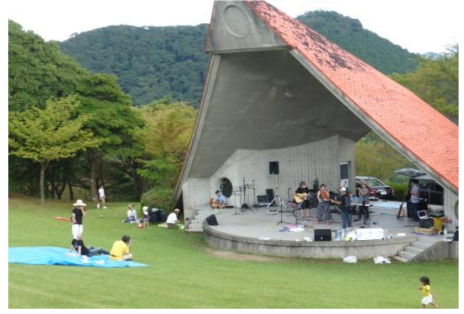
野外ステージでライブも行われました