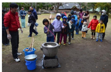
子ども達は、もちつきを楽しんでくれました