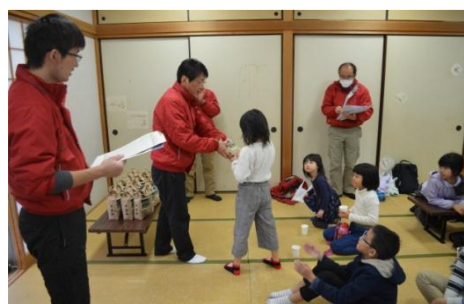
お米の贈呈式! みんながんばりました!