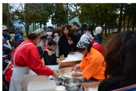
おもちは、きなこもちや飾りもちにしました