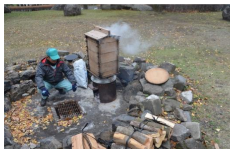
もち米は、薪と蒸し器を使って炊きます

今年のこどもこめ作り体験は、天気にも恵まれ、全てのプログラムを実施することができました。こどもこめ作り体験は、来年も実施予定ですので、今年参加された方で、参加できなかったプログラムがあった方は、ぜひ来年もご参加ください!。