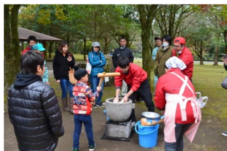
もちつきスタート!