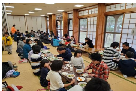
最後は、収穫したお米を皆でいただきました!

八重山公園こどもこめ作り体験は、来年も実施予定ですので皆さんぜひご参加ください!!