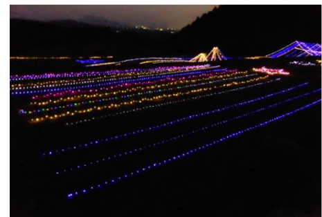
棚田のイルミネーション

～八重山公園より利用者の皆様へお願い～ ゴミは必ず自宅までお持ち帰り下さい。 近隣のゴミ捨て場等に捨てないよう、ご協力お願いします。