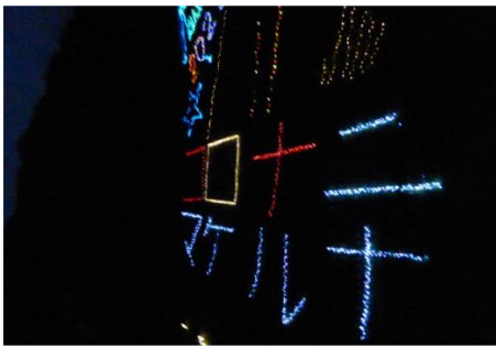
「コロナマケルナ」のイルミネーション

お問合わせ先：鹿児島市グリーンツーリズム推進課<TEL 099-216-1371>