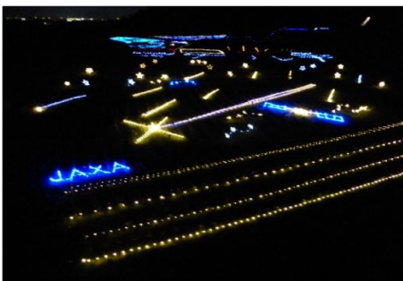
JAXAと小惑星探査機「はやぶさ2」