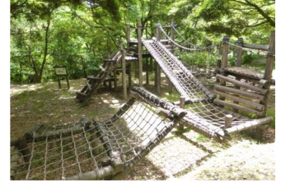
アスレチック広場

八重山公園は、標高約480メートルの八重山の中腹に位置しており、自然豊かな見晴らしのよい山間地にあります。キャンプ場としてはもちろん、公園としてアスレチック施設などの遊具も併設しております。また、コテージ・てんがら館と宿泊施設も整っているため、様々なスタイルでのアウトドアライフをお楽しみいただけます。