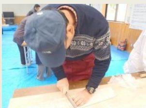
細く切るの難しいんです