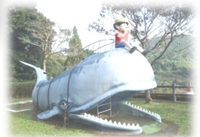
子供が楽しめる幼児広場