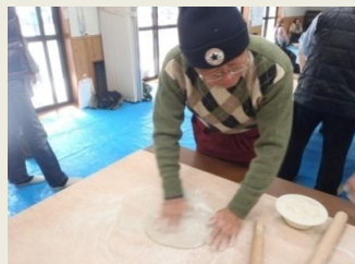
結構、力がいるんです

職場は全員 男(-_-)/~~~ やっとの思いで麺に太い細いはあるものの、香りのいい手打ちの蕎麦ができました。