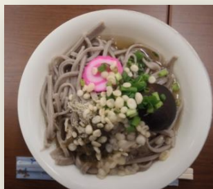
こちらが出来上がり