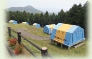
1年中利用できる常設テント