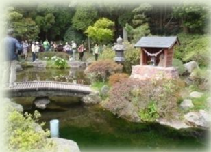
甲突川の源流「甲突池」

鹿児島市街地から車でわずか40分。広大なキャンプ場と機能的で清潔な設備で、ゆっくりとした有意義な時間と空間を、気の合う仲間やグループで楽しく過ごしませんか。