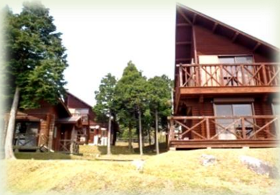
2階ロフトのあるコテージ