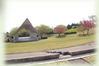
広々とした園内には野外ステージも