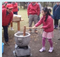
女の子も よいしょ