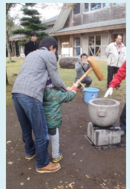
最後は親子で よいしょ！