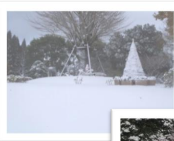
クリスマスツリーにも雪が積もりました。

八重山公園の今年の初冠雪は12月17日(水)でした。昨年より3日早い積雪です。12月は、コテージはもとよりテント泊のお客様でも賑わいました。