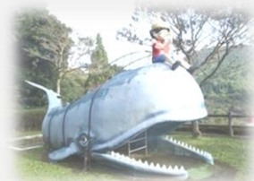
子供が楽しめる児童広場