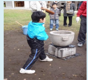
男の子も よいしょ