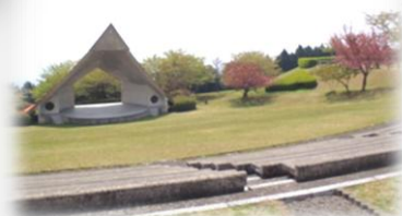
広々とした園内には野外ステージも