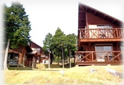
2階ロフトのあるコテージ