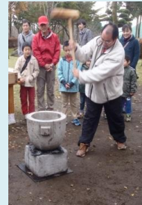
お父さんも よいしょ 力がコモッテます！