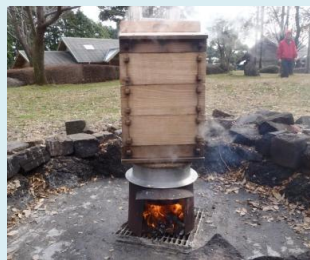
蒸籠でもち米を蒸します

12月23日(火)6月にみんなで八重の棚田に植えたもち米を使って餅つきを行いました。せいろで蒸されたもち米は子供達の手で力一杯つかれました。最後はみんなで試食会。自分たちで苗から育てたお米とお餅はきっと美味しかったです。さあ来年は、あなたのご家族も参加しませんか！？