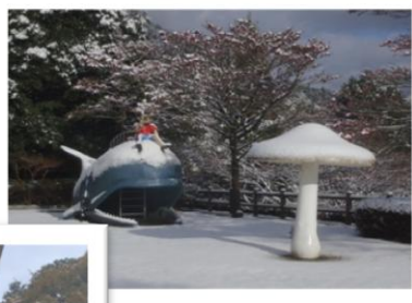
児童広場のクジラにも雪が