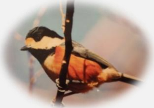
鳥名 ヤマガラ 2013年12月3日撮影