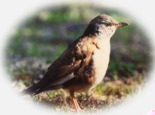
鳥名 シロハラ 2014年2月21日撮影