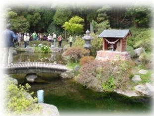
甲突川の源流「甲突池」

鹿児島市街地から車でわずか40分。広大なキャンプ場と機能的で清潔な設備で、ゆっくりとした有意義な時間と空間を、気の合う仲間やグループで楽しく過ごしませんか。