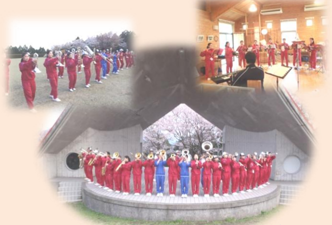
屋外ステージでポーズを とってもらいました。 キマッテマス

3月30日から2泊3日の日程で、鹿児島実業高等学校の吹奏楽部による春季合宿がてんがら館で初めて行われました。鹿児島実業の吹奏楽と言えば甲子園やサッカーの国立競技場での応援などで有名ですが、実はマーチングに関しては県内で最も歴史があるそうです。また、各種コンクールへの出場はもとより県内外問わず各地のイベントなどに積極的に参加するなど地域の活性化に一役かっています。とっても元気で礼儀正しい生徒さんでした。新年度も頑張ってください。