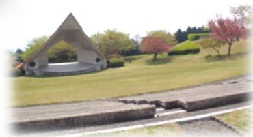
広々とした園内には野外ステージも