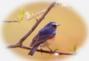
鳥名 ルリビタキ 2014年3月6日撮影

わき腹が黄色っぽい。四国以北 高山の林で繁殖し、秋冬は暖地や て位置でも見られる。