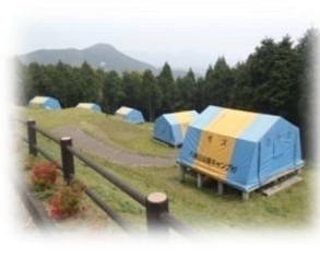
1年中利用できる常設テント