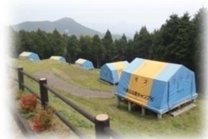
1年中利用できる常設テント