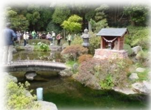
甲突川の源流「甲突池」

鹿児島市街地から車でわずか40分。広大なキャンプ場と機能的で清潔な設備で、ゆっくりとした有意義な時間と空間を、気の合う仲間やグループで楽しく過ごしませんか。