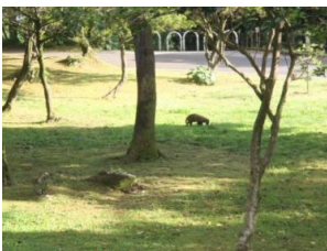
近づいてもあまり警戒しません