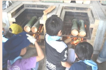
竹筒炊飯に悪戦苦闘