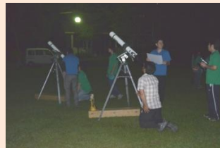
土星が見えました