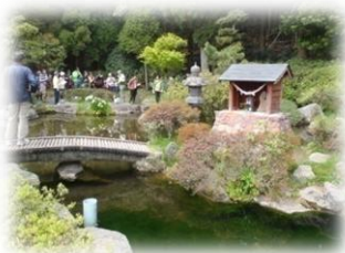
甲突川の源流「甲突池」

鹿児島市街地から車でわずか40分。広大なキャンプ場と機能的で清潔な設備で、ゆっくりとした有意義な時間と空間を、気の合う仲間やグループで楽しく過ごしませんか。