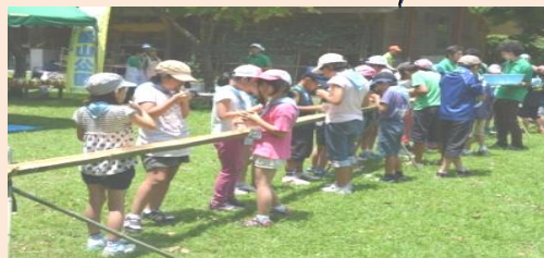
みんな楽しみにしていた孟宗竹を竹を使ったソーメン流し………お腹一杯食べました