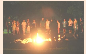
キャンプファイヤーで大騒ぎ