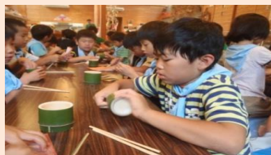
竹のはしと器づくり