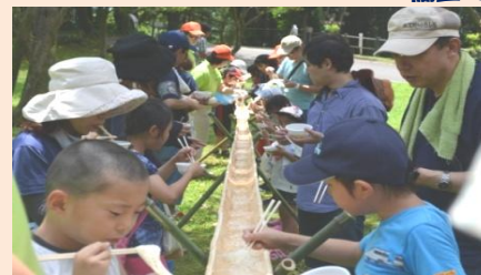
およそ30mの長い竹の上を、ソーメンが流れます