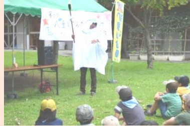
火の神から炎をわけてもらいました