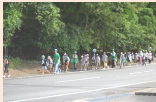
近くの棚田までハイキング