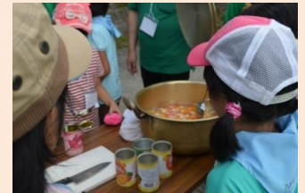
フルーツポンチを作りました