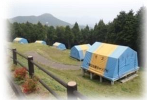
1年中利用できる常設テント