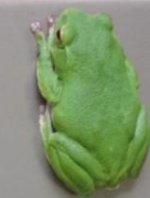
カワイイかえる発見