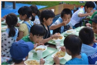
キャンプといったらカレーライス