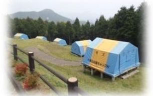
1年中利用できる常設テント