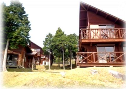
2階ロフトのあるコテージ