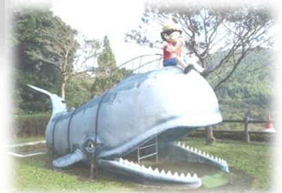
子供が楽しめる幼児広場