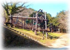
18種類のアスレチック

鹿児島市街地から車でわずか40分。広大なキャンプ場と機能的で清潔な設備で、ゆっくりとした有意義な時間と空間を、気の合う仲間やグループで楽しく過ごしませんか。