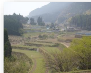
公園近くの八重の棚田