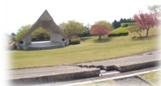
園内には野外ステージも