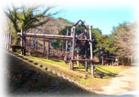
18種類のアスレチック

鹿児島市街地から車でわずか40分。広大なキャンプ場と機能的で清潔な設備で、ゆっくりとした有意義な時間と空間を、気の合う仲間やグループで楽しく過ごしませんか。