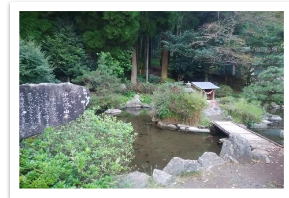
甲突池も隣接しておりますので、ぜひお立ち寄り下さい