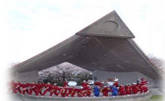
園内には野外ステージも