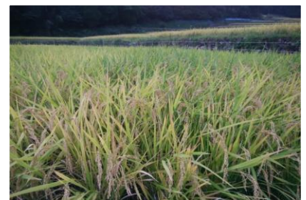
稲の状況(平成29年10月8日撮影)

今年は、2回の台風に見舞われましたが、稲は順調に育っています。皆さんに収穫される日を今か今かと待っているようです。収穫が待ち遠しいですね。