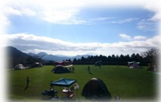
テント泊もできる多目的広場

鹿児島市街地から車でわずか40分。広大なキャンプ場と機能的で清潔な設備で、ゆっくりとした有意義な時間と空間を、気の合う仲間やグループで楽しく過ごしませんか。