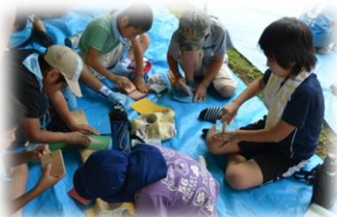
子供達の宿泊研修に