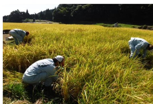
ひたすら稲を刈っていきます…