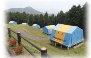
1年中利用できる常設テント