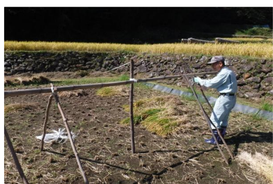
馬(稲干し台)を作っています