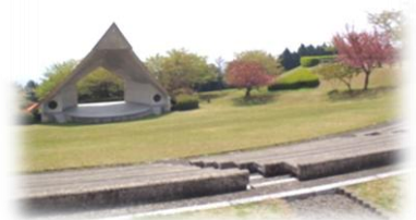
広々とした園内には野外ステージも