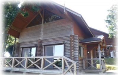
2階ロフトのあるコテージ

鹿児島市街地から桜島、錦江湾まで望む絶好のロケーション。管理棟を兼ねた交流促進センター「てんがら館」、7棟のコテージ、野外ステージ、キャンプ場、遊具、草スキー場、アスレチック等を完備した公園です。