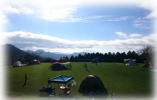
テント泊もできる多目的広場

鹿児島市街地から車でわずか40分。広大なキャンプ場と機能的で清潔な設備で、ゆっくりとした有意義な時間と空間を、気の合う仲間やグループで楽しく過ごしませんか。