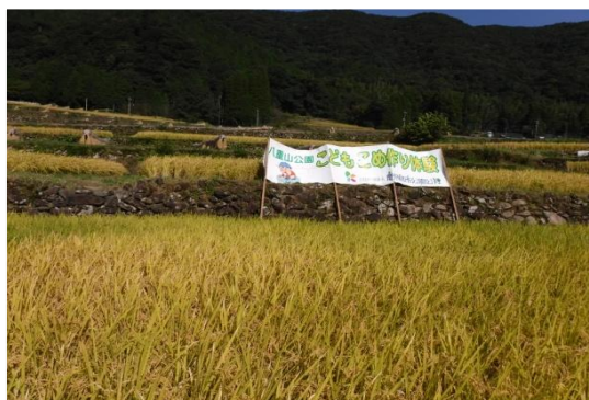
田んぼはきれいな黄金色でした

10月21日(土)開催予定の稲刈り体験が残念ながら中止となったため、管理者側で棚田の稲刈りを実施しました。5～6名で実施しましたが、全ての作業が完了するまで半日以上時間が掛かりました。終わった後は、体のアチコチが痛くなっていました。改めて稲刈りの大変さが身に染み込んだ一日でした。次回、12月2日(土)の八重山公園こどもこめ作り体験・試食会は、雨でも開催しますので、参加者の皆さんよろしくお祈りします。