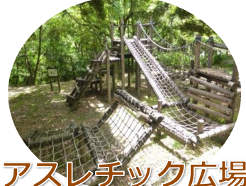
アスレチック広場