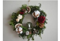
クリスマスリース作り教室