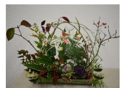
門松風寄せ植え教室