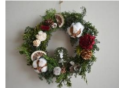
クリスマスリース作り教室