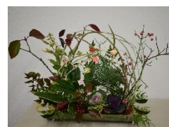
門松風寄せ植え教室