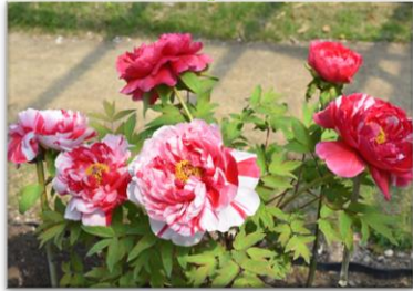
四季の山野草 ポタン (牡丹)

ポタン科ポタン属の落葉低木 場所 ぼたん園 花言葉 「風格」「高貴」「恥じらい」