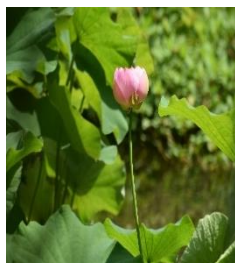
大賀ハス(1日目の開花)