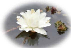
パラグアイオニバス