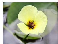
ウォーターポピー

今年の2月に植えた「大賀ハス」が8月10日に咲きました。半年前に植えたばかりでしたので、この夏、咲くのは難しいかと思っていました。これからもっと成長して沢山の花数が咲くのが楽しみです。また、パラグアイオニバスの花も10月頃まで見られます。夜19時頃から咲き始め、翌朝10時頃まで見られます。観察池に来られる際は、朝の涼しい時間帯にお越しください。1日目は白色、2日目はピンク色に変化します。他にもスイレンや日本原産のオニバス、ウォーターポピー（水草）なども咲いています。ぜひ自然観察園の水生植物をご覧ください。