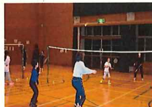
最終回、ゲームの様子