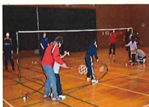
初回、サーブの練習