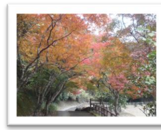
こもれびの散歩道