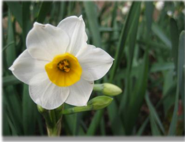
ニホンスイセン ヒガンバナ科スイセン属 「花言葉 うぬぼれ」