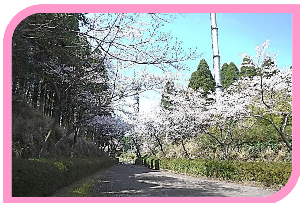
多目的広場入口周辺