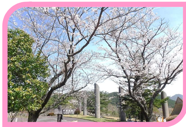
旧管理事務所周辺