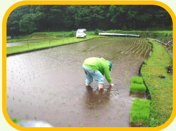
職員が田植えを行いました