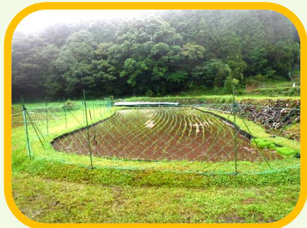
獣対策もばっちり！