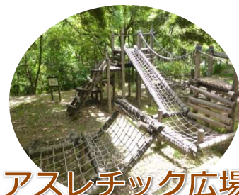
アスレチック広場