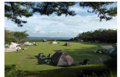
多目的広場 (テントサイト)

宿泊をキャンセルされる場合は、必ず八重山公園TEL099-298-4880へお電話をお願いします。無断キャンセルはできません。