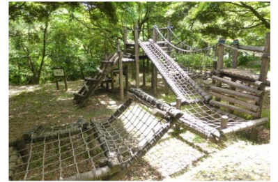
アスレチック広場

八重山公園は、標高約480メートルの八重山の中腹に位置しており、自然豊かな見晴らしのよい山間地にあります。キャンプ場としてはもちろん、公園としてアスレチック施設などの遊具も併設しております。また、コテージ・てんがら館と宿泊施設も整っているため、様々なスタイルでのアウトドアライフをお楽しみいただけます。