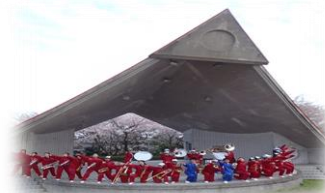
園内には野外ステージも