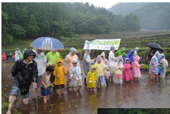
土砂降りのなか1本1本丁寧にみんなで心をこめて植えました。 今年6月

今年の6月13日に子どもたちが植えたお米の苗がすくすくとみのってきました。途中7月に予定されていた田の草取りは悪天候の為中止になってしまいその後も8月の台風の通過で大変心配しましたが、大きな影響はありませんでした。そしていよいよ来月は、収穫(稲刈り)を迎えます。収穫の様子は11月号でお知らせいたします。