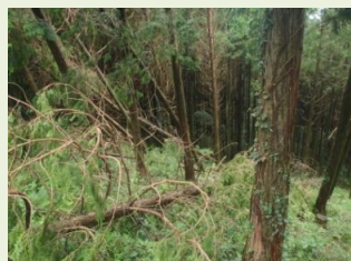
園内至る所で倒木が

9月25日に鹿児島地方を襲った台風15号の影響により、ご予約いただいていた多くの皆さまに大変なご迷惑をお掛けいたしました事に対し心からお詫び申し上げます。常設テントは暫くの間、ご予約数を調整させていただきます。どうか、ご了承願います。