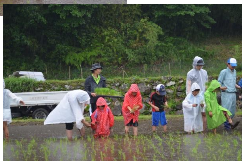
今年も普通のお米と餅米と田んぼに半分ずつ植えました。