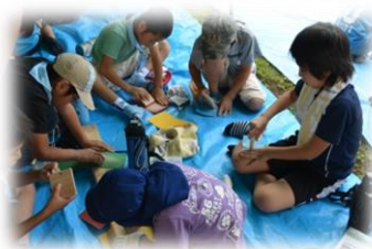
子供達の宿泊研修に