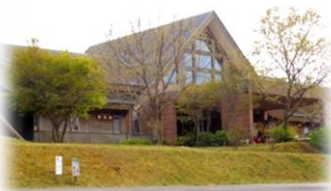
宿泊研修施設 てんがら館