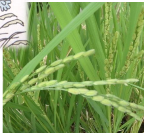
米がみのつつあいます。10月は稲刈りをした後、乾燥させる為に孟宗竹に暫くの間干します。11月には収穫したお米や餅米を使っておにぎりやお餅をつきます。