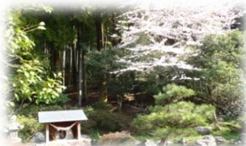
甲突川の源流「甲突池」

鹿児島市街地から車でわずか40分。広大なキャンプ場と機能的で清潔な設備で、ゆっくりとした有意義な時間と空間を、気の合う仲間やグループで楽しく過ごしませんか。