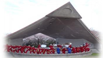
園内には野外ステージも