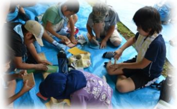
子供達の宿泊研修に