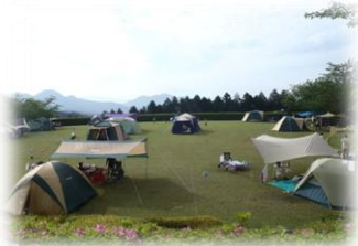
テント泊もできる多目的広場

鹿児島市街地から車でわずか40分。広大なキャンプ場と機能的で清潔な設備で、ゆっくりとした有意義な時間と空間を、気の合う仲間やグループで楽しく過ごしませんか。