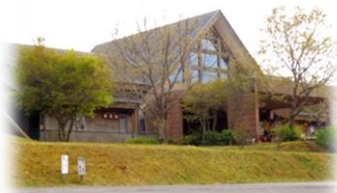
宿泊研修施設 てんがら館