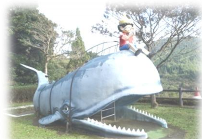
幼児も楽しめる児童広場