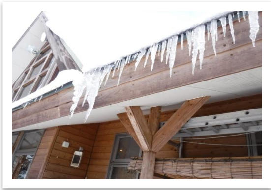
てんがら館には30cm程のつららが…