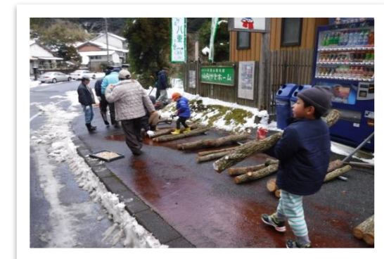
椎茸の駒打ち体験

2月12日(日)、こいやま八重の会主催により、八重の森で遊ぼう(椎茸の駒打ち体験・植樹イベント)が開催されました。当初公園を利用する予定でしたが、積雪がかなり残っていたため、公園近くのふらっとホーム(観光館)で開催されました。寒さの中、50名程の参加を頂きました。参加者は、普段体験することのない植樹の植え込み方法等についてのお話に感心していました。