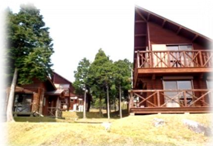
2階ロフトのあるコテージ

鹿児島市街地から桜島、錦江湾まで望む絶好のロケーション。管理棟を兼ねた交流促進センター「てんがら館」、7棟のコテージ、野外ステージ、キャンプ場、遊具、草スキー場、アスレチック等を完備した公園です。