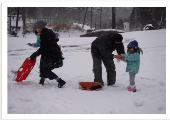
家族で楽しく雪遊び！