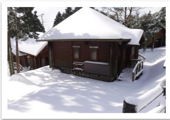
コテージ周辺も雪で真白

1月20日(金)、2月11日(土)、公園内で積雪を観測しました。特に2月11日(土)は、30cm程の積雪がありました。ここ八重山公園は標高約400mの高さにあるため、鹿児島市街地では、雪が確認されなくても、積雪することがあります。公園を訪れた利用者も、鹿児島では見慣れない雪に驚いていました。