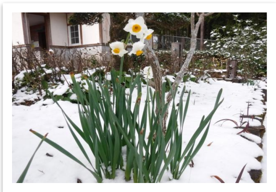
雪の中でも水仙は力強く咲いていました。