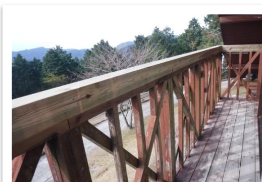
奇数棟にはベランダがあります

★ご希望の棟がございましたら、ご予約の際、お申しつけ下さい(ご予約は6ヶ月前より受付けております)。