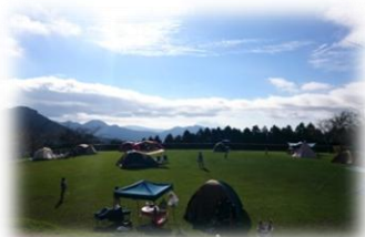
テント泊もできる多目的広場

鹿児島市街地から車でわずか40分。広大なキャンプ場と機能的で清潔な設備で、ゆっくりとした有意義な時間と空間を、気の合う仲間やグループで楽しく過ごしませんか。