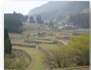
公園近くの八重の棚田