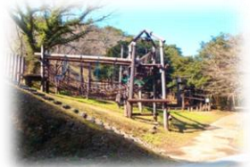
18種類のアスレチック