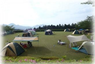
テント泊もできる多目的広場

鹿児島市街地から車でわずか40分。広大なキャンプ場と機能的で清潔な設備で、ゆっくりとした有意義な時間と空間を、気の合う仲間やグループで楽しく過ごしませんか。