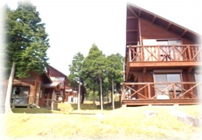
2階ロフトのあるコテージ

鹿児島市街地から桜島、錦江湾まで望む絶好のロケーション。管理棟を兼ねた交流促進センター「てんから館」、7棟のコテージ、野外ステージ、キャンプ場、遊具、草スキー場、アスレチック等を完備した公園です。