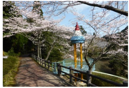
ロングローラーすべり台周辺