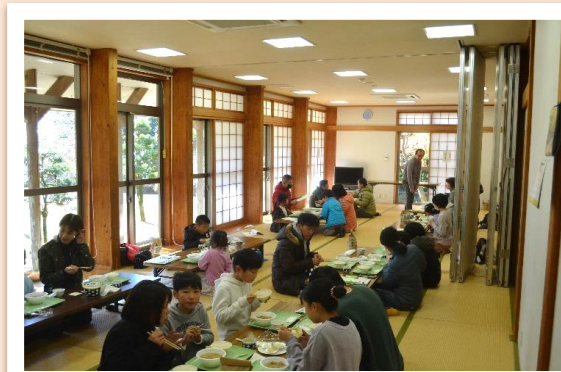
収穫したお米をみんなで味わいました！

八重山公園は、八重山(標高677m)の中腹、標高約480m地点に位置しており、自然豊かな見晴らしのよい山間地にあります。キャンプ場としてはもちろん、公園としてアスレチック施設などの遊具も併設しております。また、コテージ・てんがら館と宿泊施設を活用して、様々なスタイルでのアウトドアライフをお楽しみいただけます。