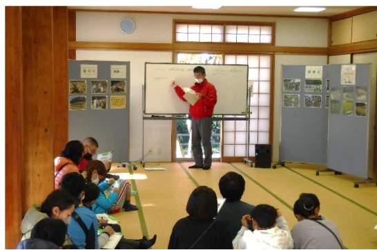
みんなでクイズに取り組みました！

12月2日(土)、試食会を実施しました。お米ができるまでの田植え～収穫についてのお話や、お米に関するクイズ、竹箸作りなどを行いました。参加者皆さんで、棚田でのこめ作りとその環境について考えていただくイベントとなりました。「こどもこめ作り体験」などのイベント情報は八重山公園ホームページ等に掲載いたしますので、是非ご覧ください。