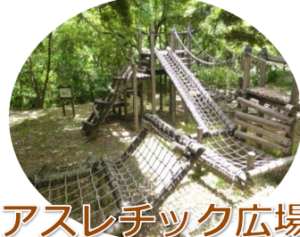
アスレチック広場